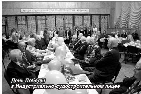
День Победы в Индустриально-судостроительном лицее