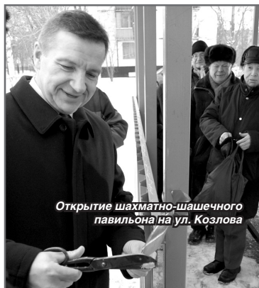
Открытие шахматно-шашечного павильона на ул. Козлова

При проведении всех значимых общественных мероприятий