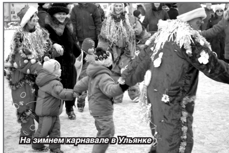
На зимнем карнавале в Ульяновке