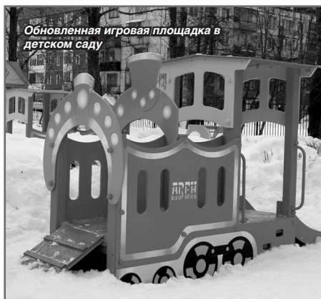
Обновленная игровая площадка в детском саду