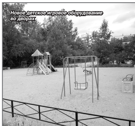
Новое детское игровое оборудование во дворах