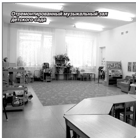
Отремонтированный музыкальный зал детского сада

→ ПРИ СОДЕЙСТВИИ ФОНДА СОВМЕСТНО С ДРУГИМИ УЧАСТНИКАМИ БЫЛА ОКАЗАНА ПОМОЩЬ ШКОЛАМ, ДОШКОЛЬНЫМ УЧРЕЖДЕНИЯМ И ПРОФЕССИОНАЛЬНЫМ УЧИЛИЩАМ