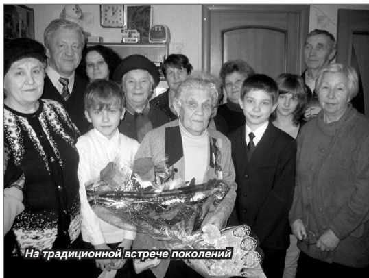
На традиционной встрече поколений