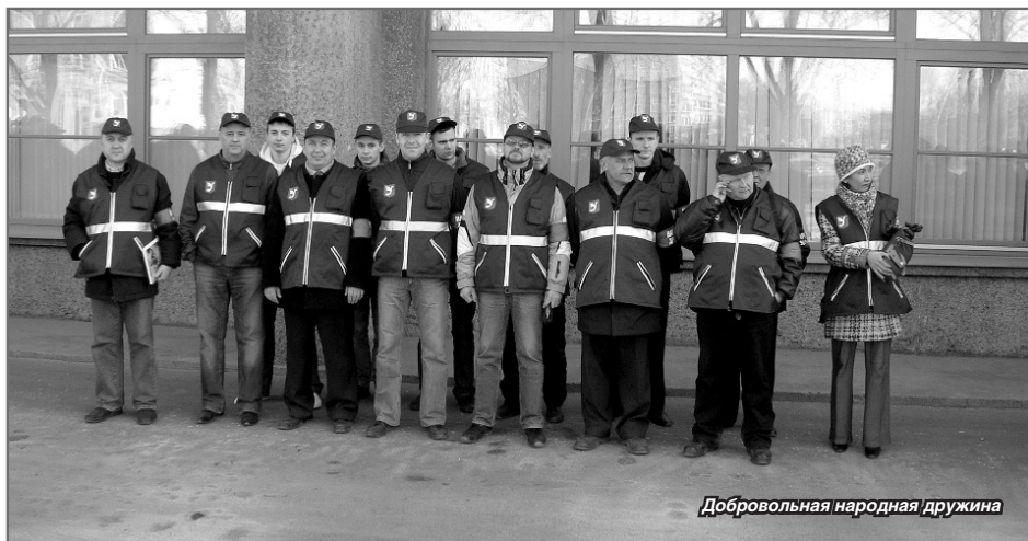
Добровольная народная дружина

За 5 лет сотрудниками УВД Кировского района, совместно с бойцами дружины, было задержано за различные административные правонарушения 672 человека. Дружинники помогли сотрудникам УВД в раскрытии 46 преступлений, оказывали помощь инспекторам МИФНС России №19 при проведении проверок правил осуществления торговой деятельности на территории МО Ульянка, совместно со специалистами МО Ульянка вели активную работу по