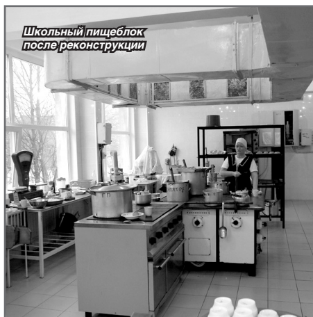
Школьный пищеблок после реконструкции